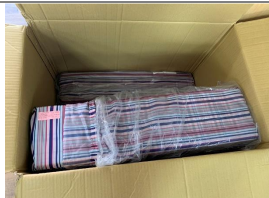
照片5：加厚折疊睡墊25組