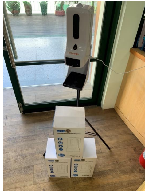
照片3：酒精自動消毒機3台