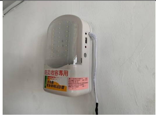
照片1：緊急照明燈1台